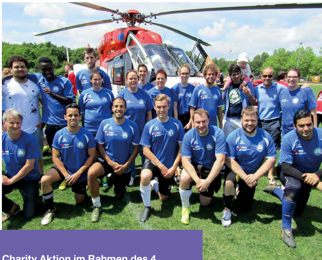
Charity Aktion im Rahmen des 4. ICU-Fußballturniers organisiert von der Intensivtherapiestation der Universitätsmedizin Mannheim