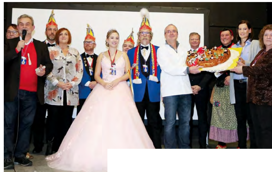
Neujahrsempfang in Mannheim Gartenstadt, Spende vom Bürgerverein und Geschenk der Neujahrsbrezel von der Bäckerei Döringer`s Backhaus