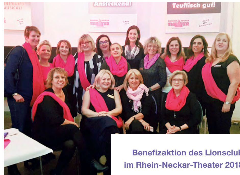
Benefizaktion des Lionsclub im Rhein-Neckar-Theater 2018