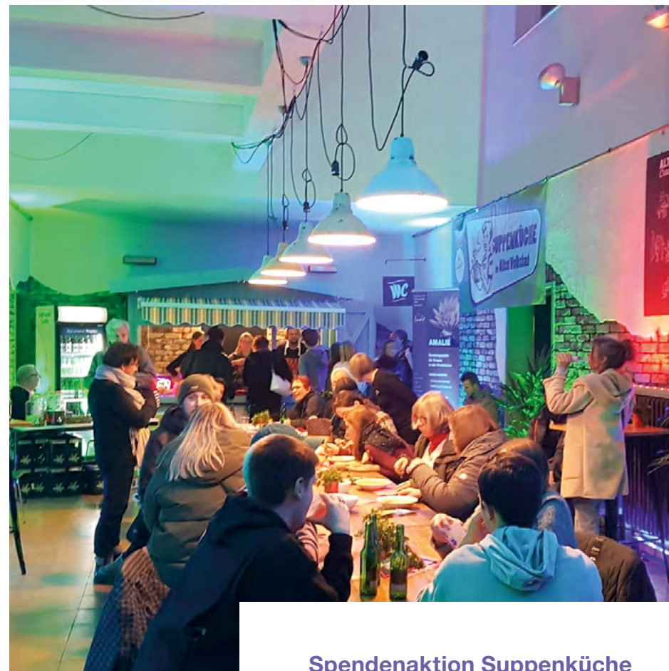
Spendenaktion Suppenküche im Rahmen der Lichtmeile in der Neckarstadt-West