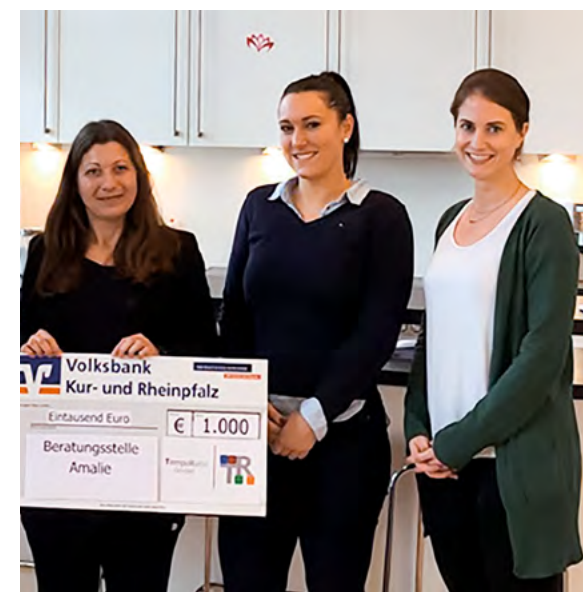
Spendenübergabe der Firma Temporatio