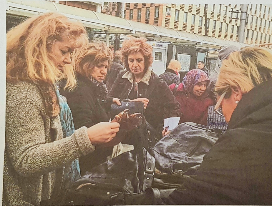
Bei Taschen kennen Frauen kein Halten mehr: Ob zum Umhängen oder für die Hand – nahezu jedes Modell gab es gestern am Verkaufsstand des Deutschen Frauenrings auf dem Paradeplatz. Der Erlös geht komplett an die Prostituiertenberatungsstelle Amalie.

Deswegen ist sie auch begeistert von dem Verwendungszweck der Einnahmen. Mit der Beratungsstelle Amalie wird das Geld direkt vor Ort in Mannheim eingesetzt. Es soll den Prostituierten helfen. Nicht nur bei einem Ausstieg aus dem Milieu, sondern auch bei Problemen im Alltag, etwa durch kostenlose Arztbesuche,